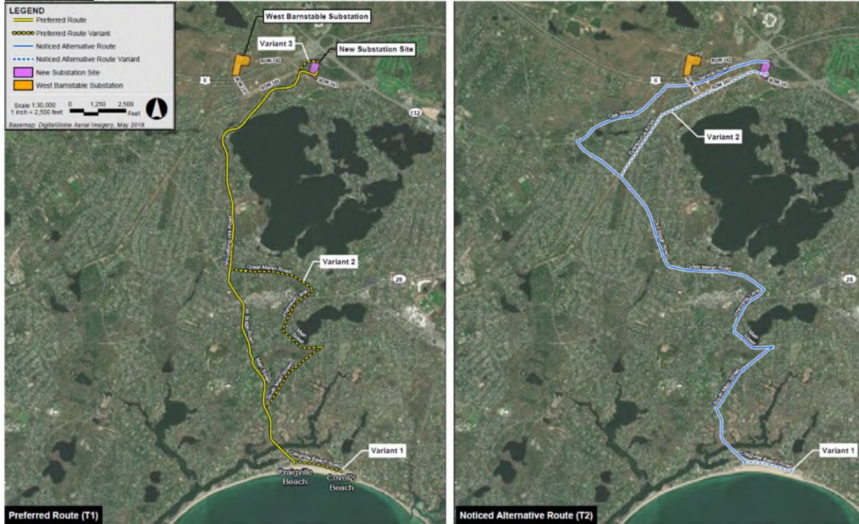
Imagem 2: Conector Vineyard Wind 2 - Rotas Terrestres, Aterro na Nova Subestação Terrestre

Uma versão maior desta imagem está disponível no seguinte link: